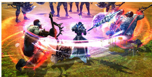
『ユグドラシル』ゲーム内画像