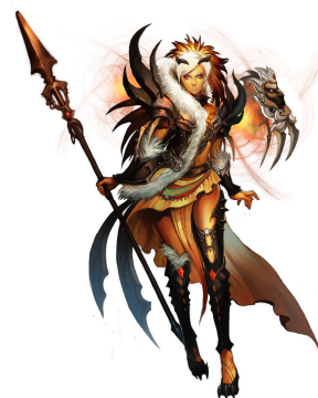
『ユグドラシル』 イメージイラスト

※上記画像はイメージです。予告なく変更する場合がございますので、ご了承ください。