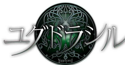
『ユグドラシル』ロゴ

タイトル : ユグドラシル ジャンル : MMORPG 課金形態 : 基本プレイ無料(アイテム課金方式) ガンホーゲームズでの開始時期 : 2011年11月9日(水)15:00からチャネリングサービス開始。 特徴 : 北欧神話をベースにした壮大な世界観ながらもPC環境を問わずに“誰でも簡単に”プレイできるオンラインRPG。神々が創造した世界には、オリジナルペットを育成するシステムや、ギルド単位で戦う領土戦など様々な楽しみが用意されています。 ガンホーゲームズ内公式サイト : http://www.gungho.jp/yggdrasil/promotion/ (15:00オープン予定) コピーライト表記 : Copyright © 2011 C&C Media Co., Ltd. All Rights Reserved. © Perfect World Co.,Ltd. ALL RIGHTS RESERVED.