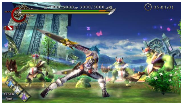
次々と襲い掛かってくるモンスター達、臨戦態勢をキープ！