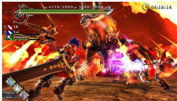
仲間との連携が巨大モンスター攻略のポイントになる