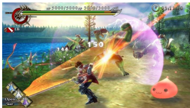
ソードウォーリアの強烈な一撃が屈強なオークをのけ反らせる