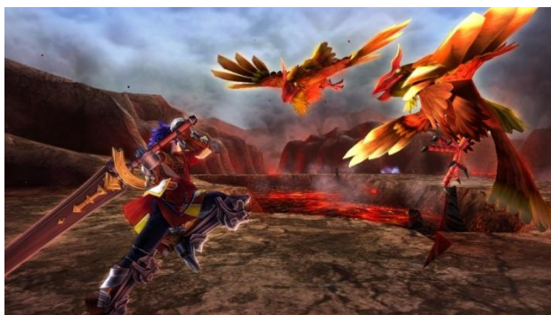
空中から迫り来るモンスターは、空中で迎え撃て！