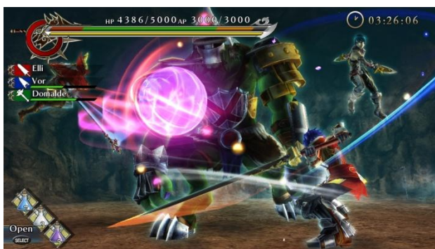
仲間と力を合わせ巨大モンスターを打ち倒せ！