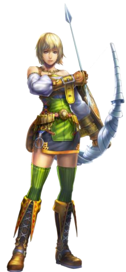
ハンター(孤高の狩人)