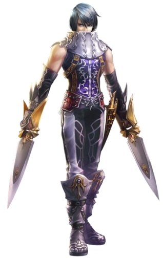
アサシン(スピードスター)