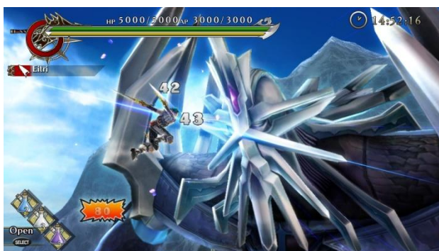
巨人「フルングニル」の頭部めがけて駆けあがれ