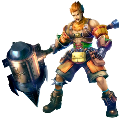
ハンマースミス(剛力無双)