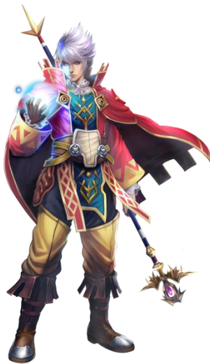
メイジ(武闘魔法士)