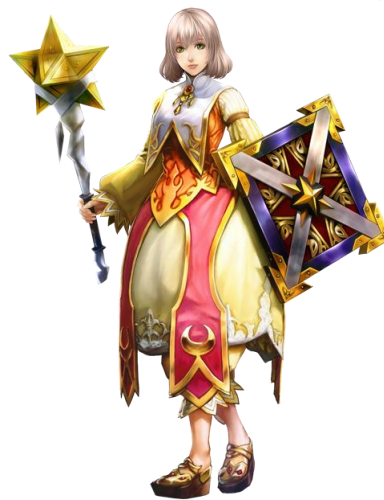
クレリック(神罰代行人)