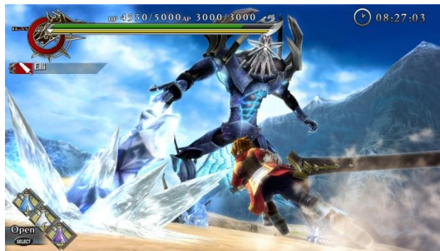
巨人「フルングニル」との壮絶な死闘がはじまる