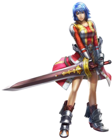
ソードウォーリア(攻守兼備)