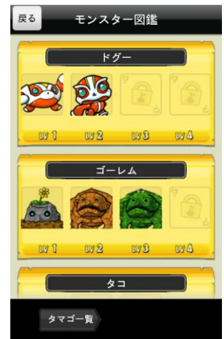
モンスター図鑑画面