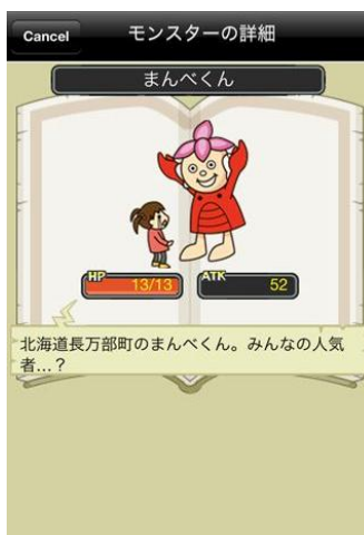
先駆けて登場した長万部町のゆるキャラ「まんべくん」