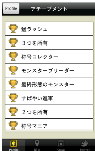
アチーブメント(実績)一覧