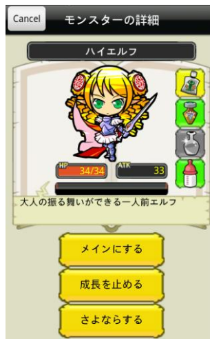
マイモンスターの詳細画面