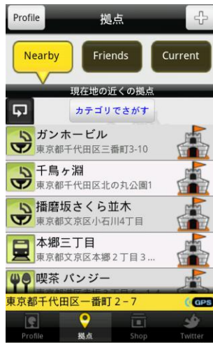
位置情報に基づく拠点検索