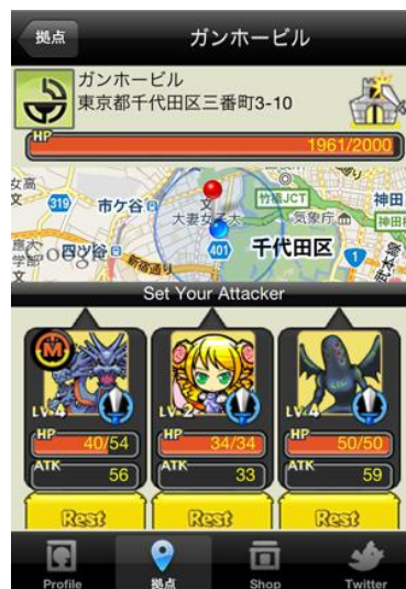
拠点攻撃イメージ