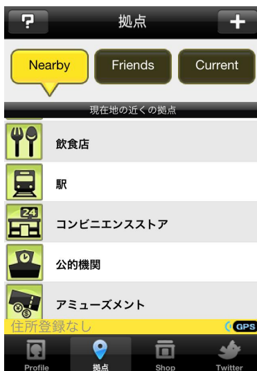
拠点検索イメージ