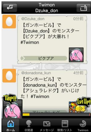
タイムライン表示イメージ