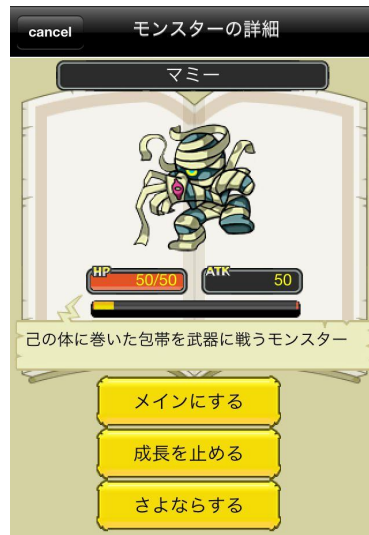
モンスター詳細表示イメージ