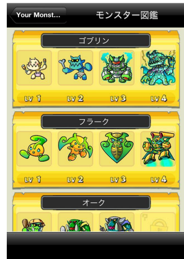
モンスター図鑑イメージ