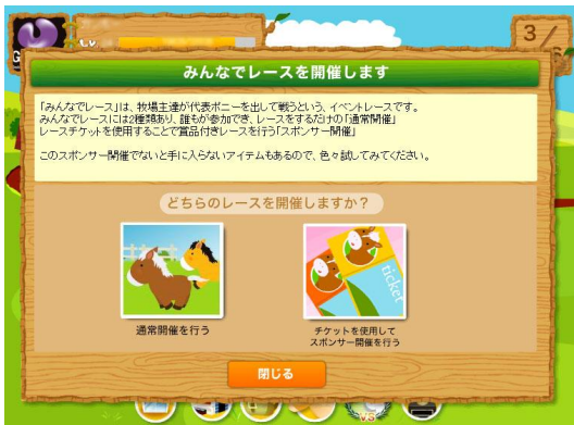
『ほのぼのポニーライフ』ゲーム内画像