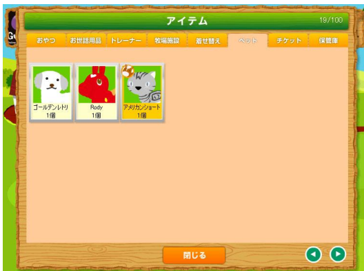
『ほのぼのポニーライフ』ゲーム内画像