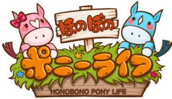
『ほのぼのポニーライフ』ロゴ