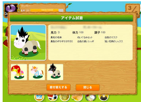
『ほのぼのポニーライフ』ゲーム内画像