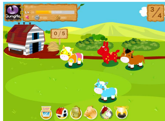
『ほのぼのポニーライフ』ゲーム内画像