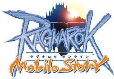
「ラグナロクオンライン Mobile Story」ロゴ