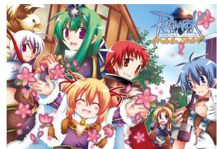
正式サービス記念キャンペーンイラスト