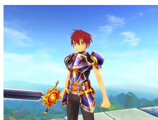
怒涛の連続キャンペーン第3弾 プレゼントアイテム「太陽の剣」「日蝕の鎧」