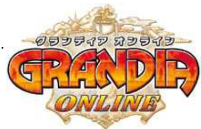
『グランディア オンライン』ロゴ