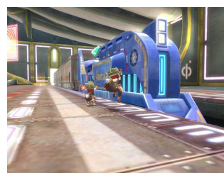
ゲーム内画像 (新実装の交通機関「列車」)