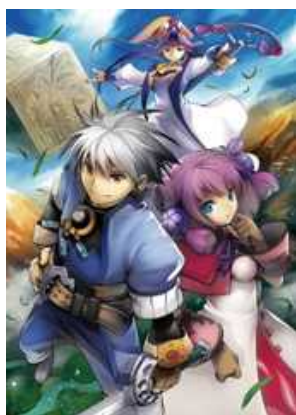
『グランディア オンライン』メインビジュアル