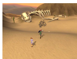
ゲーム内画像 (カロール砂漠)

上記ゲーム内画像は開発中のものです。デザインなど予告なく変更する場合がございます。