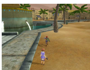
ゲーム内画像 (砂漠の町アシュタル)