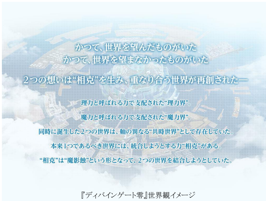
『ディバインゲート零』世界観イメージ