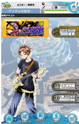
『ディバインゲート零』 ホーム画面イメージ