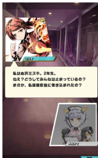
『ディバインゲート零』 アドベンチャーパート画面イメージ