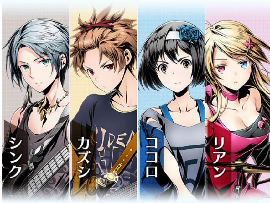
『ディバインゲート零』主人公イラスト