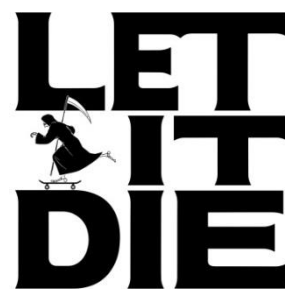
『LET IT DIE』ロゴ