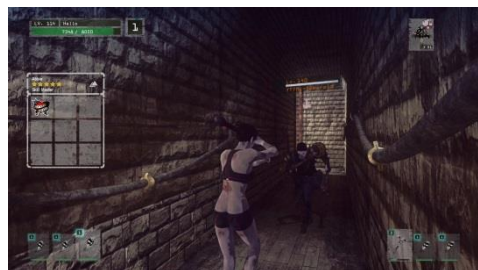
“バルブの塔”内(女性ファイター)