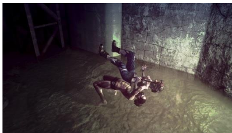
多彩なアクション