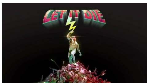
“デスドライブ 128”スタート画面