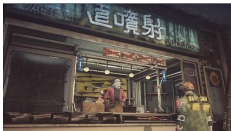
武器の開発を手伝ってくれる「直噴者」