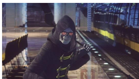
人懐っこい死神「アンクル・デス」