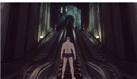
“パンイチ”でスタート(男性ファイター)