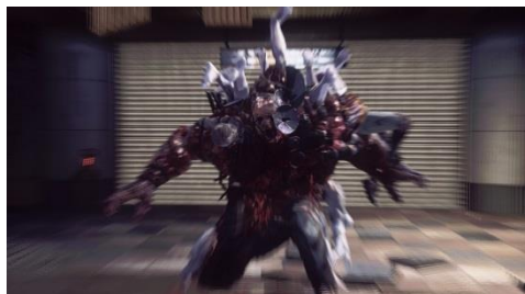
待ち受けるエネミー