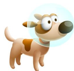
バディ「愛犬パッション」