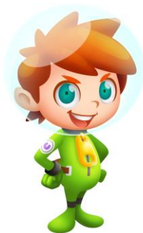
プレイヤーキャラクター「コロン」