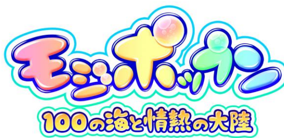
『モジポップン』ロゴ