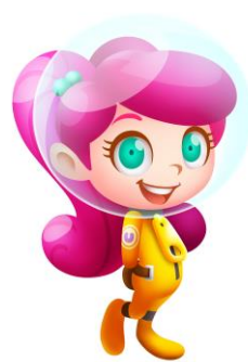
プレイヤーキャラクター「カナン」