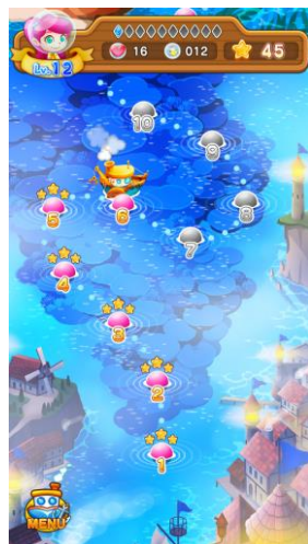
大海洋で待ち受ける 100のステージ