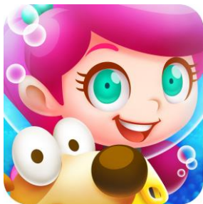
『モジポップン』アプリアイコン