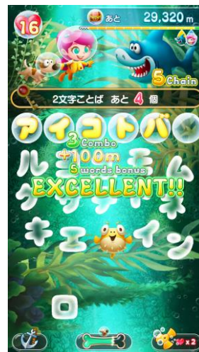
個性豊かな海の主と タイムアタック対戦