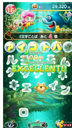
個性豊かな海の主とタイムアタック対戦