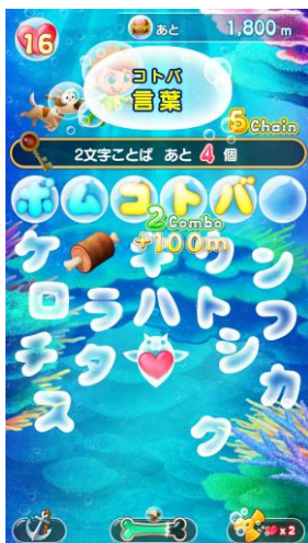
文字をつなげて「コトバ」をつくらう