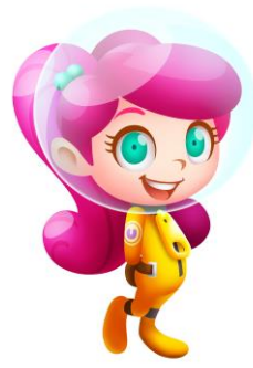
プレイヤーキャラクター「カナ」