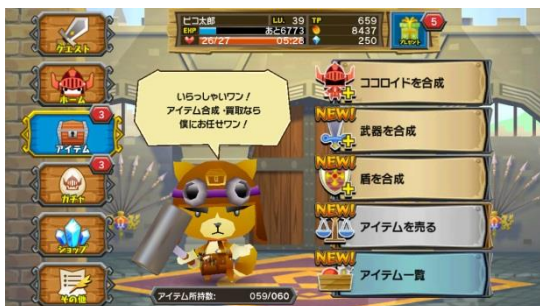
アイテム強化: ココロイド、武器、盾は合成で強化可能