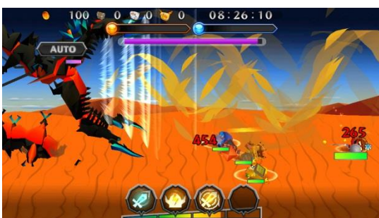
クエスト内:流砂から現れた巨大な黒虫