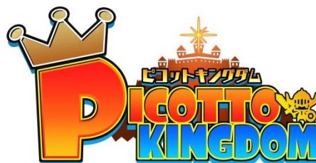
『ピコットキングダム』ロゴ