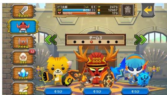
ココロイド選択:チームを組んで出撃