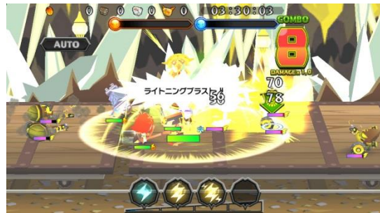
クエスト内:スキル「ライティングブラスト」発動