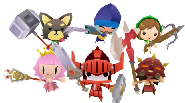
武器の 카테고리 は 6 種