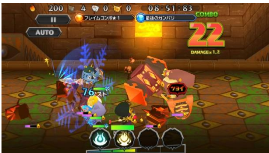
クエスト内:タッチ操作で多彩なアクションが可能