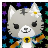
公式ツイッターアカウントアイコン