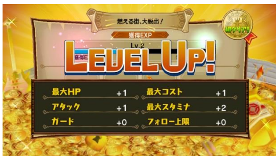
リザルト画面:レベルアップ画面