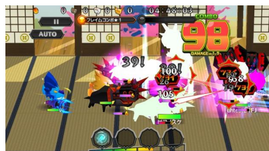
クエスト内:コンボするほどダメージがUPする