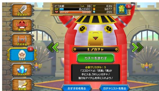
ガチャで新アイテムゲット