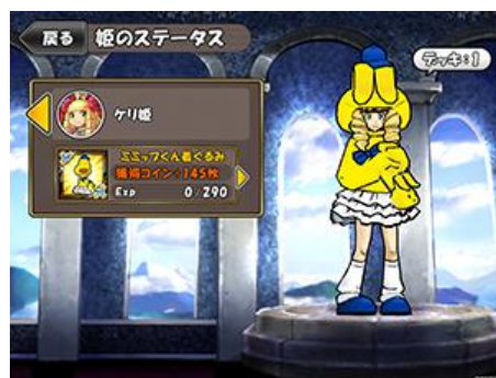
【コラボ限定ドレスやアイテムも登場】