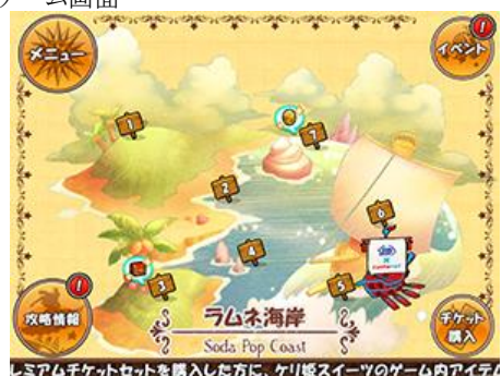
【エリアに出現するコラボ宝船】