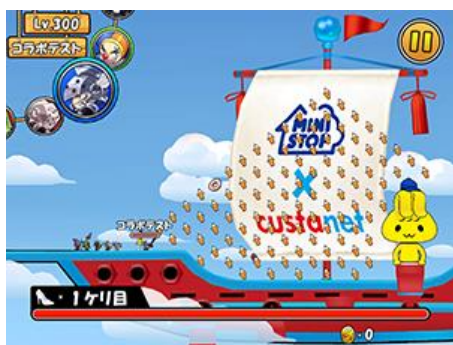
【コラボ宝船には「ミミックくん」が登場】