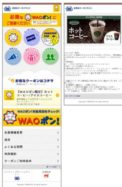
※画面はイメージです