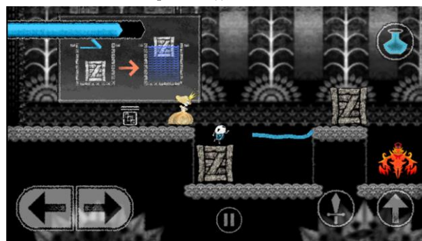
チョークを使って何かが起こる！