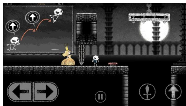
「Dokuro」は2段階ジャンプが可能！