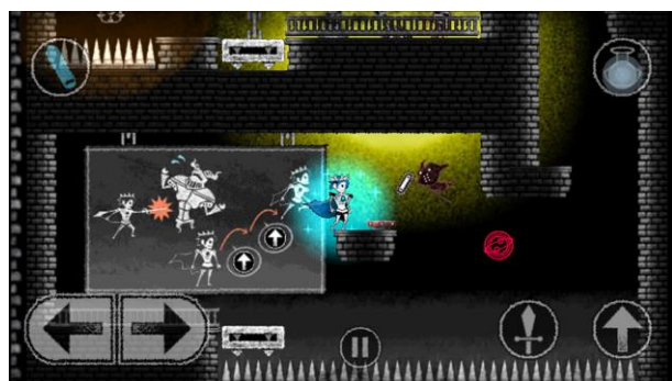
「イケメン」は剣を扱いモンスターに立ち向かう！