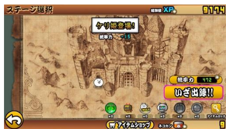
『にゃんこ大戦争』 「ケリ姫ステージ」登場