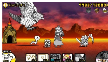
『にゃんこ大戦争』 コラボ敵キャラクター「ユーリンチー」