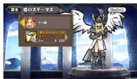
『ケリ姫スイーツ』「にゃんこラッシュ」でGET!? 「黒ネコバルキリーコス」