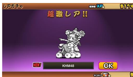
『にゃんこ大戦争』 コラボガチャで登場「KHM48」