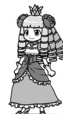
『ケリ姫スイーツ』をプレイして 『にゃんこ大戦争』を起動でGET！