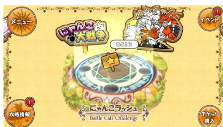
『ケリ姫スイーツ』 「にゃんこラッシュ」ステージ登場！