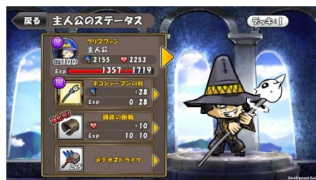
『ケリ姫スイーツ』 「ネコシャーマンの杖」装備！