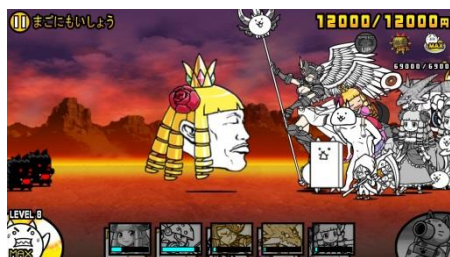
『にゃんこ大戦争』 コラボ敵キャラクター「プリンセス・カオル」