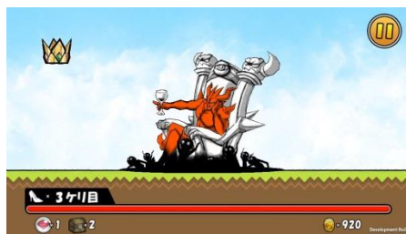
『ケリ姫スイーツ』 コラボ敵キャラクター「悪の帝王ニヤンダム」