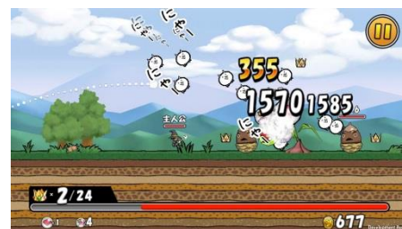
『ケリ姫スイーツ』 「ネコシャーマンの杖」からは にゃんこメテオストライク！