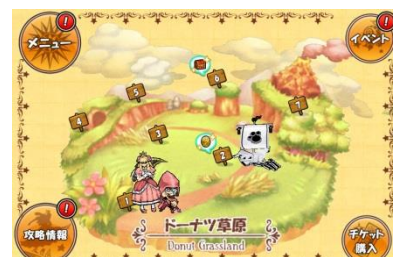
『ケリ姫スイーツ』 「にゃんこ宝船」出現！