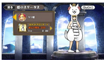
『ケリ姫スイーツ』「にゃんこステージ」でGET!? 「白ネコドラゴンスイーツ」