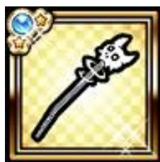
『にゃんこ大戦争』をプレイして 『ケリ姫スイーツ』を起動でGET！