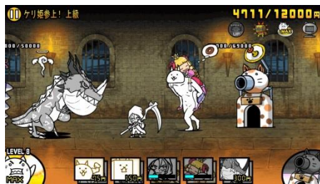
『にゃんこ大戦争』 新コラボキャラクター「眠れるケリの美女」