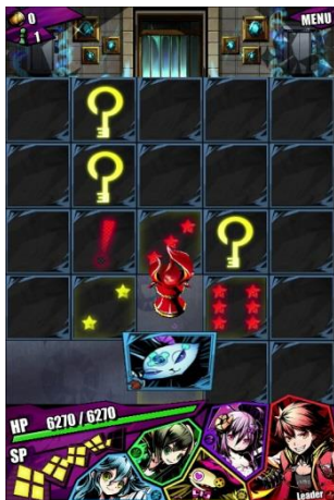
ダンジョン内探索中