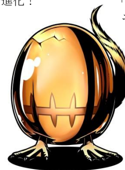
合成素材「ゴールドエッグ」