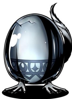
合成素材「メタルエッグ」