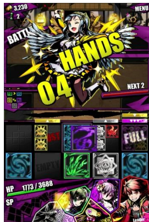
パネルを駆使してバトル！