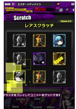
「レアスクラッチ」で ユニットをゲット！