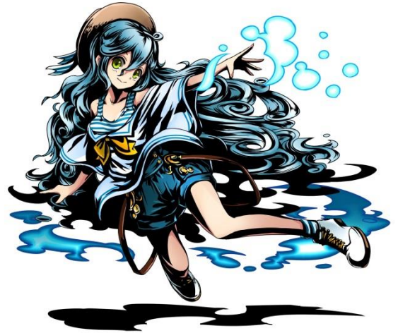
回復能力に長けた水の妖精 「ウンディーネ」