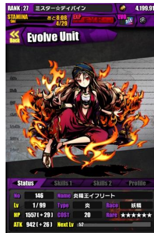
キャラクターを進化！