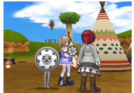
『エミル・クロニクル・オンライン』ゲーム内アイテム 『うちわ』『半纏(にしこくん)』