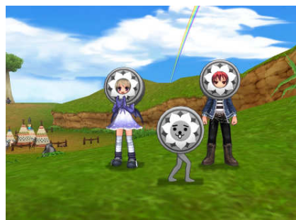
『エミル・クロニクル・オンライン』 ゲーム内アイテム『にしこくんヘッド』