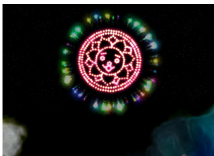
『エミル・クロニクル・オンライン』 ゲーム内アイテム『花火』