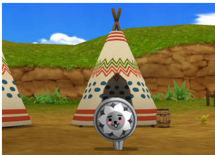
『エミル・クロニクル・オンライン』 『にしこくん』がタイニーアイランドに登場