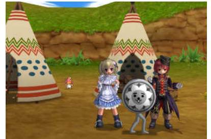
『エミル・クロニクル・オンライン』 『にしこくん』がタイニーアイランドに登場