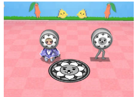
『エミル・クロニクル・オンライン』 ゲーム内アイテム『じゅうたん』

※上記画像はイメージです。予告なく変更する場合がございますので、ご了承ください。