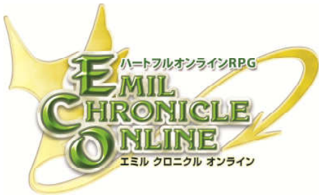
『エミル・クロニクル・オンライン』ロゴ