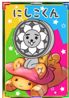
『エミル・クロニクル・オンライン』ゲーム内アイテム 「タイニー×にしこくんのイラストカード」