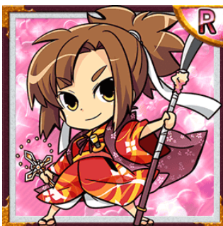
姫 R 「豪姫」