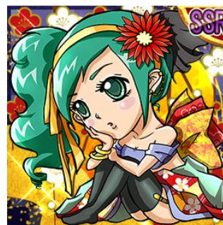
姫 SSR 「崇源院」