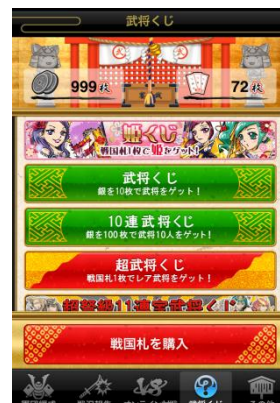
「姫くじ」挑戦はこちらから