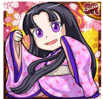
姫 SR 「千姫」