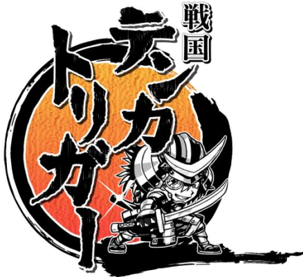
『戦国テンカトリガー』ロゴ