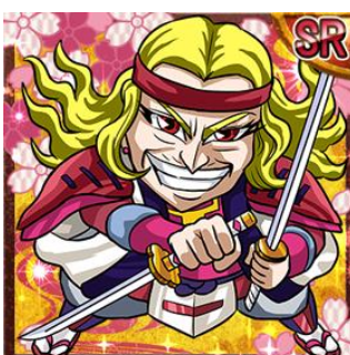
姫 SR 「妙院尼輝子」