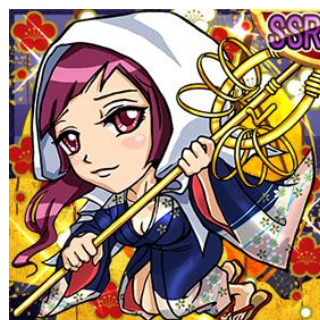
姫 SSR 「常高院」