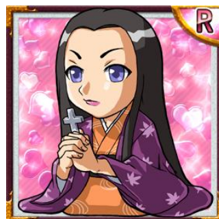
姫 R 「細川ガラシャ」