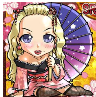
姫 SR 「出雲阿国」