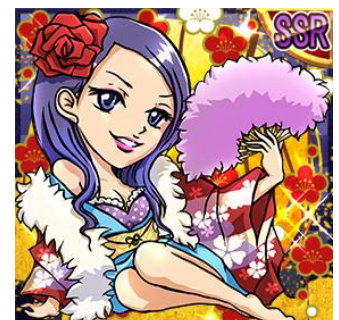
姫 SSR 「淀殿」