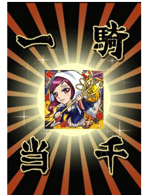
「姫くじ」で一騎当千！ SSRの姫ゲット！