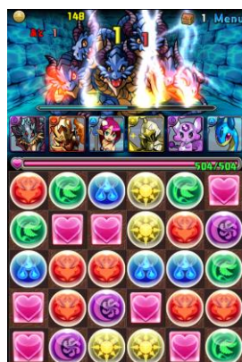
ドロップを揃えて ボスモンスターを撃退！