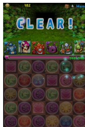
ボスモンスターを撃退 ダンジョンクリア！