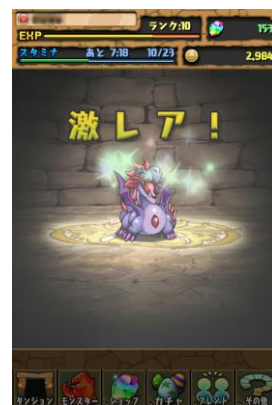
レアモンスター 誕生！