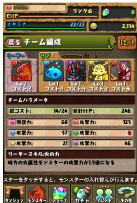
ダンジョンや戦略に合った モンスターを選択