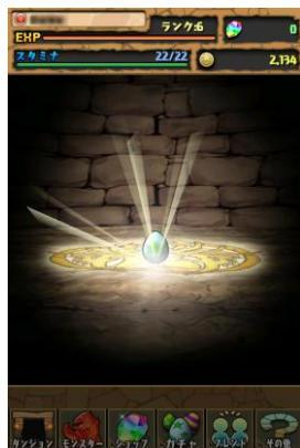
ダンジョンクリアで ゲットした卵が孵化・・・！