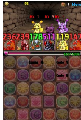
コンボで 大量攻撃が発動！