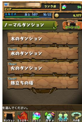
チームを編成したら ダンジョンを選択して冒険へ