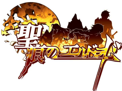
『聖痕のエルドラド』ロゴ