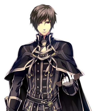
『聖痕のエルドラド』キャラクターイメージイラスト

※上記画像はイメージです。予告なく変更する場合がございますので、ご了承ください。