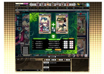
『聖痕のエルドラド』ゲーム内画像