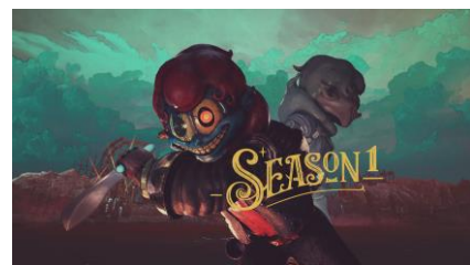
シーズン1メインビジュアル

サービス開始に合わせて、約3ヶ月間続くシーズン1が開幕いたします。今シーズンのテーマは「レトロフューチャー」です。近未来とレトロ感がMIXされた各種スキンをご用意しましたので、自分の好みのカスタマイズをお楽しみください。