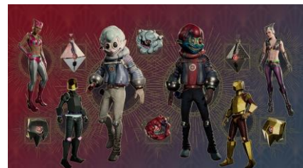
シーズン1商品一覧

サムライの戦装束である「SAMURAIバンドル」や、レトロフューチャーの一種の完成形である「スチームパンクバンドル」など各種バンドルも登場いたします。