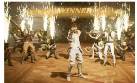
「エキシビジョンゲーム」結果画面②

ルームゲームでは各種報酬は獲得できませんが、参加人数やCPUプレイヤーの有無といったルールなどをカスタマイズすることができます。