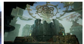
ステージ 「トレント・ガーデン」