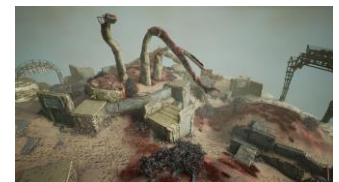
ステージ 「ホッパー・ハッピーランド」

【URL】 https://deathverse.com/jp/member/stage/