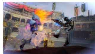
「ショーダウンゾーン」 イメージ