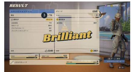
「エキシビジョンゲーム」結果画面①

最大16人のバトルを行い、最後の1人になることを目指します。敵を倒したり、特定のアイテムを手に入れたりすることで獲得した「GP」は、バトル終了後にすべて「ランクポイント(RP)」に交換されます。獲得した「RP」に応じてランキングが変動し、上位に入賞するほど、よりよい報酬を手に入れることができます。