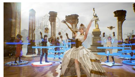
ゲーム内イメージ

そのため、観客からたくさんの「GP」をもらうことが勝利への近道と言えるでしょう。