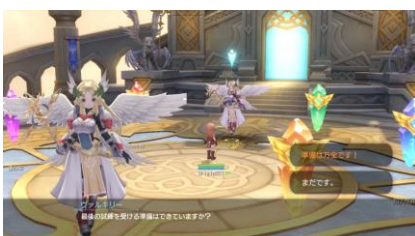
チュートリアル時のファンシー