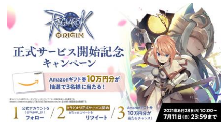
「正式サービス開始記念キャンペーン」開催

【URL】 https://ragnarokorigin.gungho.jp/news/article-66732551/