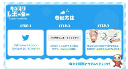
「ラグオリレポーター」スタート

【URL】 https://ragnarokorigin.gungho.jp/community/reporter/