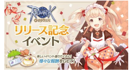
「リリース記念イベント」開催

【URL】 https://ragnarokorigin.gungho.jp/news/article-97310431/