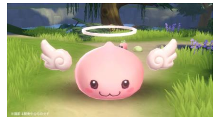
MVP モンスター「エンジェリング」