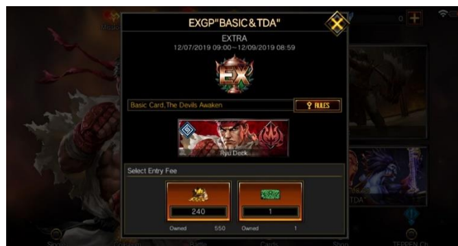
「EXグランプリ」イメージ

「EXグランプリ」は、短期間で開催される特別な対戦方式のグランプリです。通常のグランプリとは異なり、開催ごとに設定された特殊なルールのもと、規定回数内で何回勝利できるかをチャレンジするコンテンツとなります。最高勝利数に応じて最新のパックチケットや、月ごとに代わる特別なカードなどを手に入れることができます。