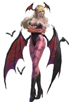
モリガン・アーンズランドのヒーローズキン