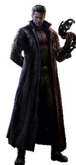
アルバート・ウェスカーのヒーローズキン