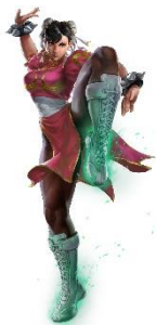
春麗のヒーローズキン

“WC2019 Selection Pack”を購入すると新コンテンツ「ヒーローズキン」を一定の確率で手に入れることができます。「ヒーローズキン」は「春麗」用「リオレウス」用「モリガン・アーンズランド」用「アルバート・ウェスカー」用の4種類があります。「ヒーローズキン」を使うと、ヒーローの見た目やキャラクターを変えてバトルができ、「ヒーローアーツ」発動時に変更されたビジュアルでお楽しみいただけます。お気に入りのキャラクターをカスタマイズすることで、対戦相手と同じキャラクターを使用しても、違った雰囲気ゲームをお楽しみいただけます。なお、「ヒーローズキン」単体でのご購入はできません。