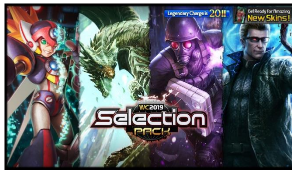
“WC2019 Selection Pack”イメージ

カードパックを購入すると溜まる数値で、チャージが最大値まで溜まると最高レアリティのカード(レジェンダリー)をひくことができます。