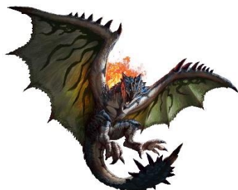
リオレウスのヒーローズキン