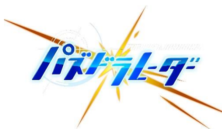
『パズドラレーダー』ロゴ