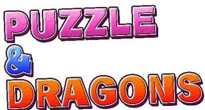
『パズル&ドラゴンズ』ロゴ