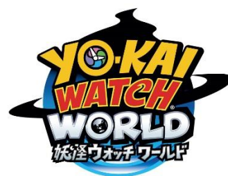
『妖怪ウォッチ ワールド』ロゴ