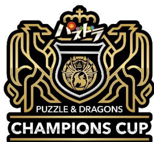
『パズドラチャンピオンズカップ 2019』ロゴ