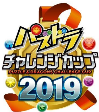
『パズドラチャレンジカップ 2019』ロゴ