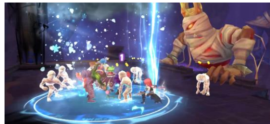
ゲーム内イメージ③