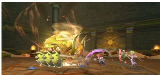
ゲーム内イメージ④