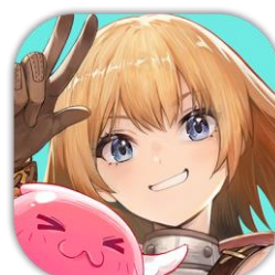
『ラグナロク X』アプリアイコン