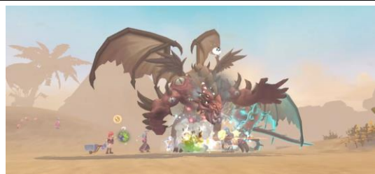
ゲーム内イメージ②

事前登録開始にあわせて、『ラグナロクX』公式サイトを本日オープンし、X、YouTubeなど各SNSの公式アカウントを開設いたしました。公式サイトでは、『ラグナロクX』の世界観や各種職業、システム紹介などのコンテンツを早くお楽しみいただけます。また、正式サービス開始時に「正式サービス記念特典」としてユーザーの皆様にはプレゼントするゲーム内アイテムも公開しています。今後も『ラグナロクX』の公式サイトおよび各種公式SNSアカウントにて、最新情報やキャンペーンに関する情報を随時お知らせいたします。ぜひご登録ください。