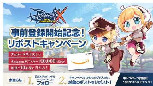
リポストキャンペーンイメージ

事前登録開始を記念して、Xにてリポストキャンペーンを実施します。『ラグナロクX』の公式Xアカウントをフォローし、キャンペーンハッシュタグが入った対象のポストをリポストしてください。抽選で各期間10名様、合計30名様にAmazonギフトカード 10,000円分が当たります。ぜひ、公式アカウントをフォローして、キャンペーンにご参加ください。