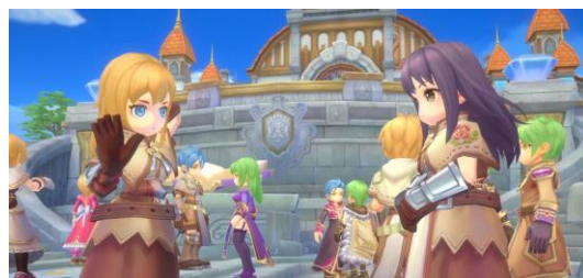
ゲーム内イメージ①

強力なモンスターが待ち受けるダンジョンや、プレイヤー同士のバトルなど、やり応えはシリーズ屈指！ 広大なミッドガルドの世界を旅する大勢のプレイヤーと協力し、“極”難度のラグナロクに挑みましょう！