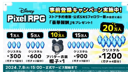
『ディズニー ピクセル RPG』 事前登録キャンペーン

Instagram: https://www.instagram.com/PixelRPG_official