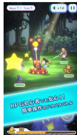
RPG 初心者でも安心！ 簡単操作のドタバタバトル