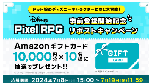
『ディズニー ピクセル RPG』 事前登録開始記念リポスト キャンペーン

最新情報は随時お知らせいたします。スマートフォン向け完全新作 RPG『ディズニー ピクセル RPG』に、どうぞご期待ください。