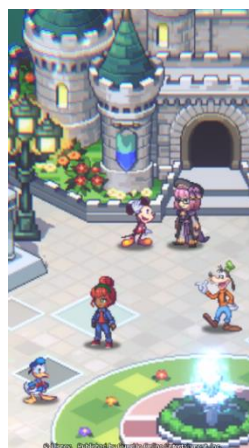
ディズニーの ドット絵 RPG が登場！

簡単操作 & オート機能で誰でも手軽にバトルを体験できるほか、プレイヤーアバターの着せ替えや、放置しておくことで自動的にアイテムを集めてくれる探索機能など、バトル以外にもお楽しみいただける要素が詰まっています。