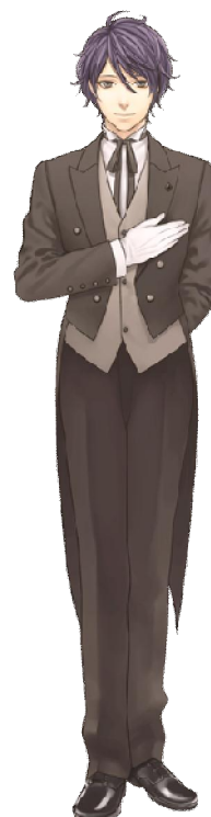
「タッチ★マイ執事」執事・柳 立ち絵

※上記画像はイメージです。予告なく変更する場合がございますので、ご了承ください。