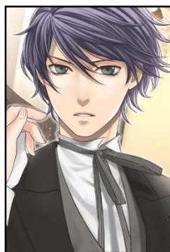
「タッチ★マイ執事」スチル画像