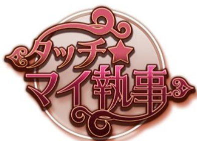
「タッチ★マイ執事」ロゴ