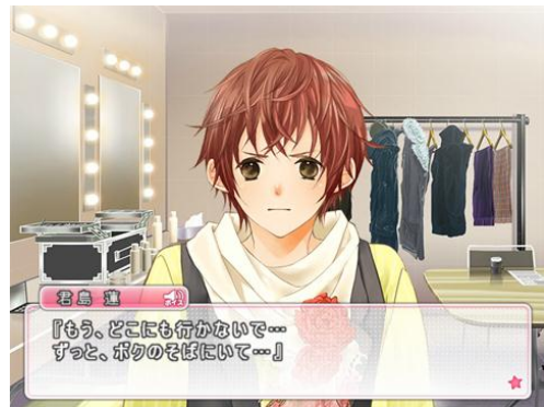
「がーるず★パラダイス ～逆ハーレム編集部～」画面写真2

※上記画像はイメージです。予告なく変更する場合がございますので、ご了承ください。