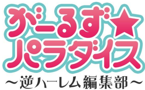
「がーるず★パラダイス ～逆ハーレム編集部～」ロゴ