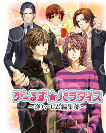
「がーるず★パラダイス ～逆ハーレム編集部～」 キービジュアル