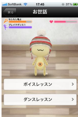
とっても簡単なレッスン