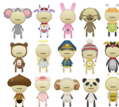
かわいい衣装が 30 種類以上