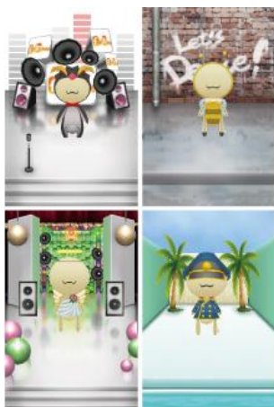
オンリーワンの替え歌ステージ