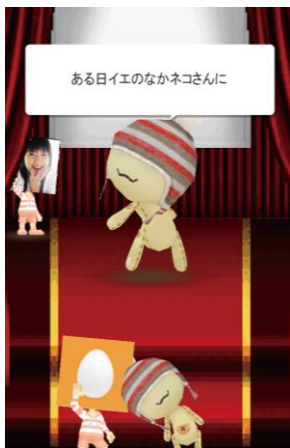
替え歌ステージの完成