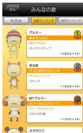
替え歌を見せ合える掲示板