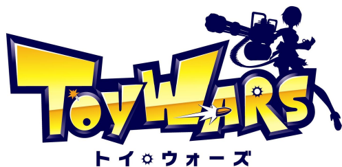
「トイ・ウォーズ」 ロゴ