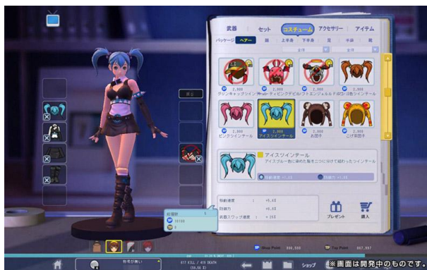
「トイ・ウォーズ」 キャラクター着せ替え画面