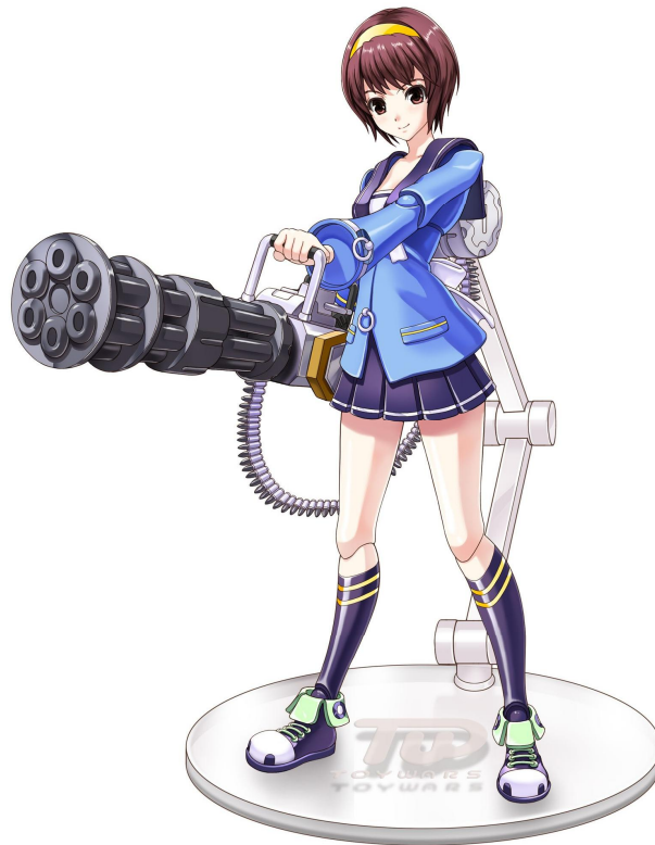
「トイ・ウォーズ」 キャラクターイラスト