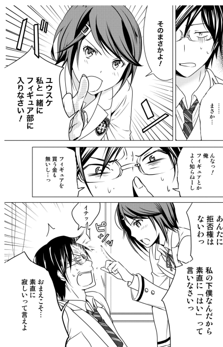
Webコミック 「TOY WARS」