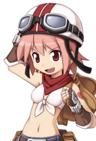
ゲーム内アイテム 「スクーターヘルメット」