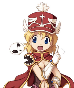
ゲーム内アイテム 「真っ赤なマーチングハット」