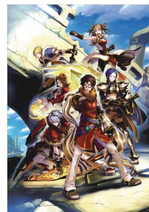
上記イラストを使用した パッケージデザインとなります。