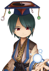
ゲーム内アイテム「黒蛇王の帽子」