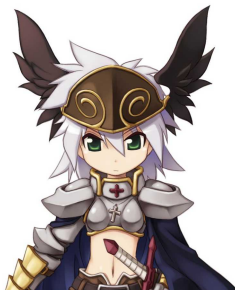
ゲーム内アイテム「ダークネスヘルム」