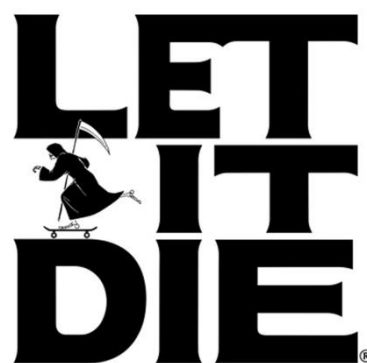
『LET IT DIE』ロゴ