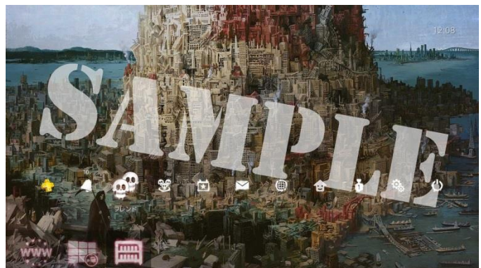
PS4®用テーマ(サンプル)