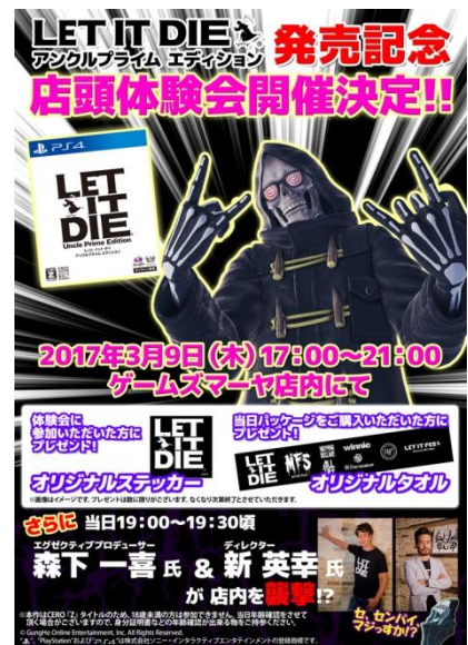
店頭体験会開催決定！