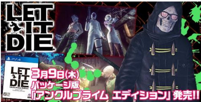
『LET IT DIE アンクルプライムエディション』発売！