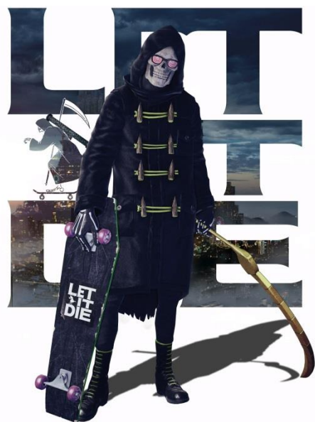
『LET IT DIE』キービジュアル