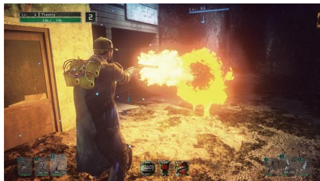
開発で強力な武器を手に入れよう！