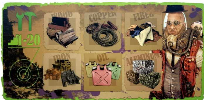
「開発素材大収穫祭」開催！