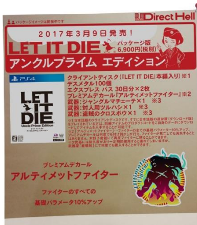
クライアントディスクと 6つの豪華アイテム付き！