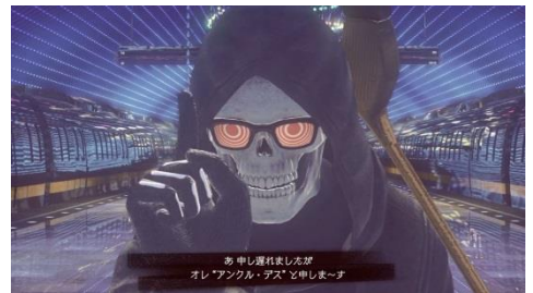
ゲーム内「アンクル・デス」登場