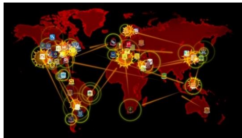
東京デスマトロ_抗争イメージ