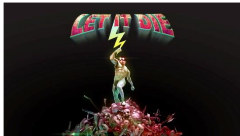
“DEATH DRIVE 128”タイトル画面