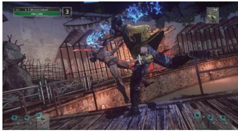
ゲーム内戦闘_レイジムーブ