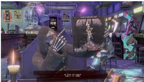
ゲームセンターHATED_ARCADE 内