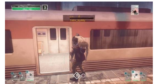
東京デスマトロ_襲撃