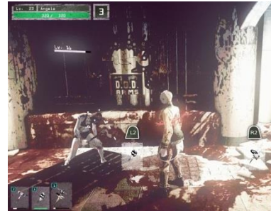
ゲーム内戦闘_ゴアティカルアタック