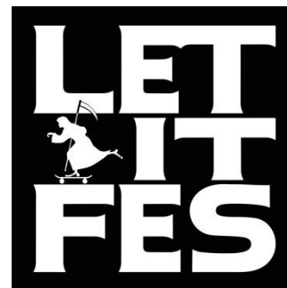
「LET IT FES」ロゴ