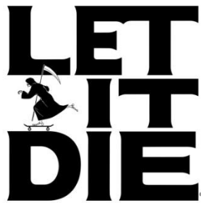
『LET IT DIE』ロゴ