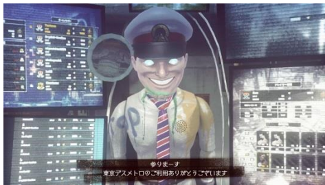
東京デスマトロ_鉄男