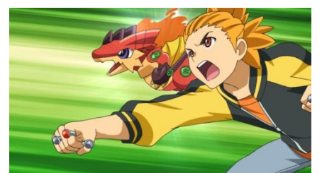
新しい旅の仲間、タイガー