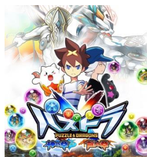
イメージビジュアル