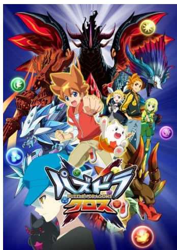
TVアニメ『パズドラクロス』 メインビジュアル