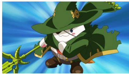
覚醒オーデインの力で戦うタマゾー