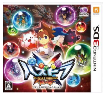
『パズドラクロス 龍の章』 パッケージ画像