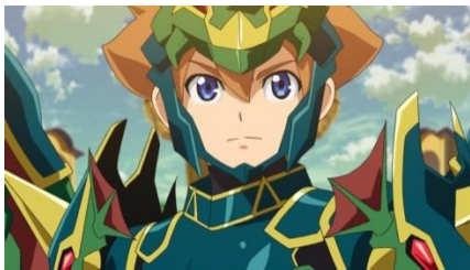
ソウルアーマーを装備したエース