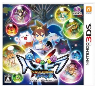
『パズドラクロス 神の章』 パッケージ画像