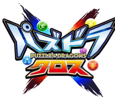
TVアニメ『パズドラクロス』 ロゴ