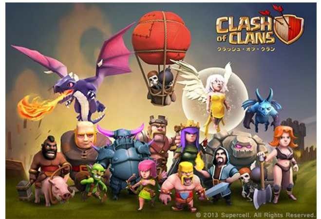
『Clash of Clans』キャラクター (原作より)