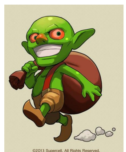
『パズル&ドラゴンズ』に登場する 「CoC・ゴブリン」