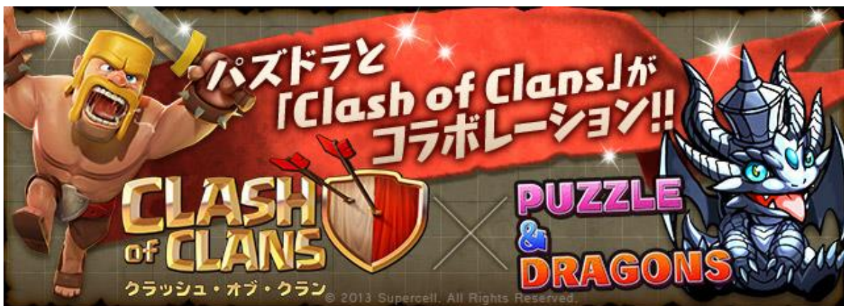
「コラボレーション企画」ロゴバナー