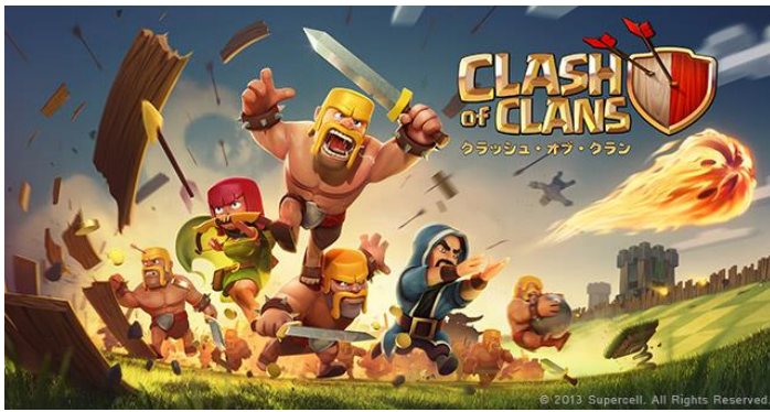
『Clash of Clans』タイトル画面