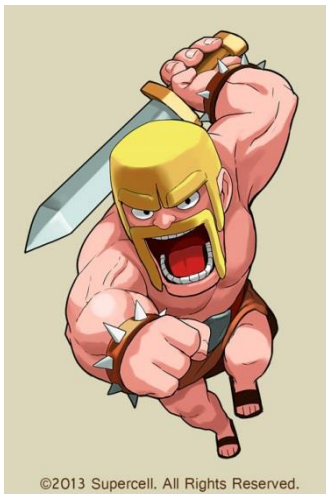
『パズル&ドラゴンズ』に登場する 「CoC・バーバリアン」