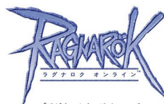
「ラグナロクオンライン」ロゴ