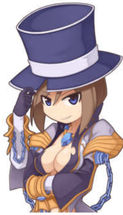
オウルデュークのシルクハット[1]