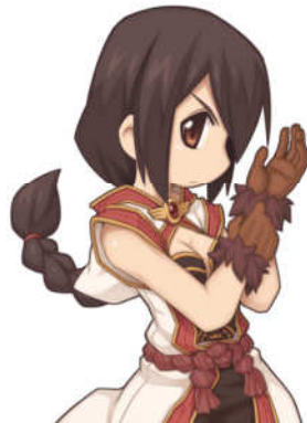
セーフリームニルの手袋[1]