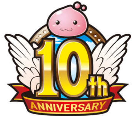
「ラグナロクオンライン」10周年ロゴ

※上記画像はイメージです。予告なく変更する場合がございますので、ご了承ください。