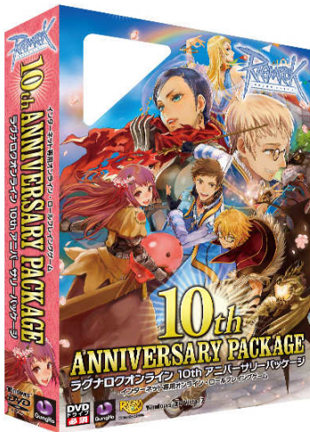
10th アニバーサリーパッケージ イメージ画像