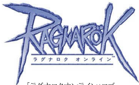
「ラグナロクオンライン」ロゴ