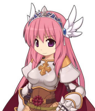
ヴァルキリーサークレット[1]