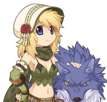
ローズキャスケット[1]