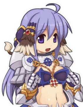
インペリアルフェザー[0]