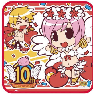
「タオル」イメージ画像