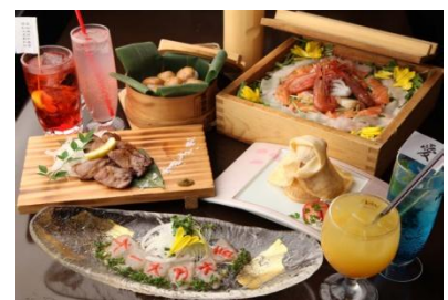
コラボレーションメニュー