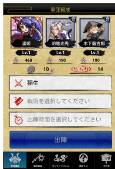
戦国武将を3名選んで「軍団」を編成