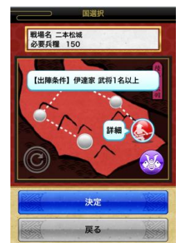
新ステージ「裏日本」