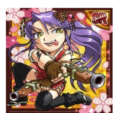
「立花闇千代」カード