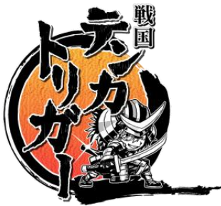
「戦国テンカトリガー」ロゴ