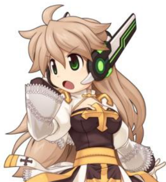
マジカルブースター[0]