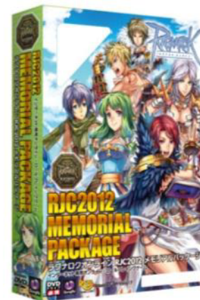
ラグナロクオンライン