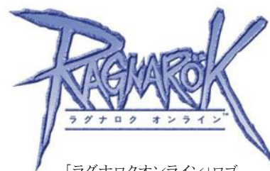
「ラグナロクオンライン」ロゴ