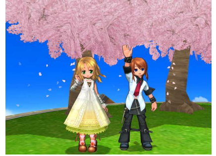
『エミル・クロニクル・オンライン』ゲーム内画像