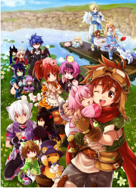
『エミル・クロニクル・オンライン』 『SAGA15: 永遠の絆』メインイラスト