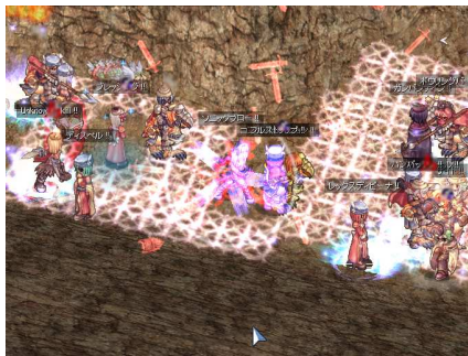
『ラグナロクオンライン』ゲーム内画像